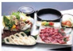
ケータリングメニュー 一例