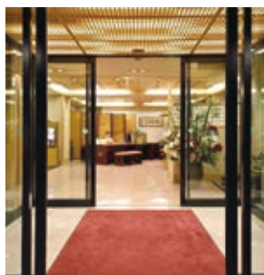
エントランス・フロント