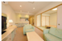
お部屋の室内一例