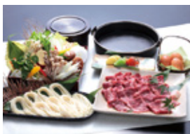
ケータリングメニュー 一例