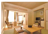
露天風呂付特別室