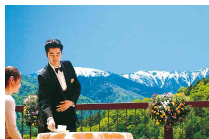
スカイガーデンテラス

休館日：11/29～12/1、1/10～13、2/13～16 入湯税別途150円(中学生以上)