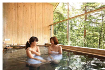
北アルプス展望露天風呂