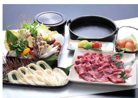
ケータリングメニュー 一例