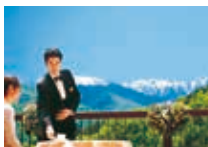
スカイガーデンテラス