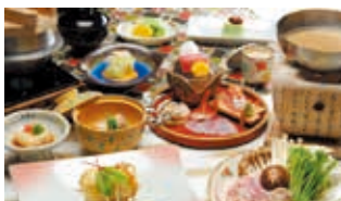
季節の海・山の幸を取り入れた夕食（一例）