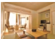
露天風呂付特別室