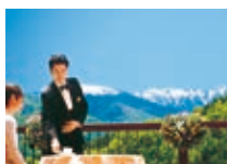
スカイガーデンテラス