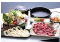
ケータリングメニュー 一例