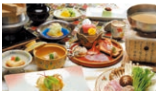
季節の海・山の幸を取り入れた夕食（一例）