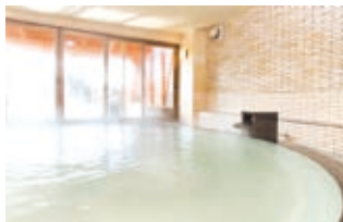
大湧谷から引湯の白濁温泉 露天風呂も併設